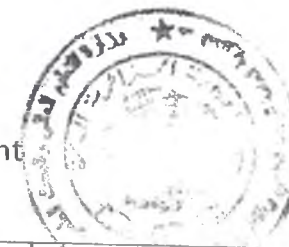
Tableau des établissements d'enseignement supérieur à couvrir par le Centre de Développement des Energies Renouvelables-CDER