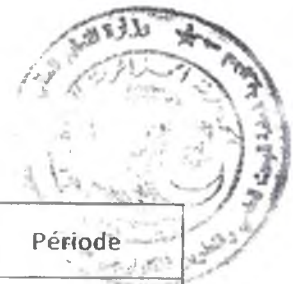
Tableau des établissements d'enseignement supérieur à couvrir par le Centre de Développement des Technologies Avancées-CDTA