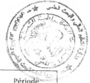
Tableau des établissements d'enseignement supérieur à couvrir par le Centre de Recherche en Mécanique-CRM