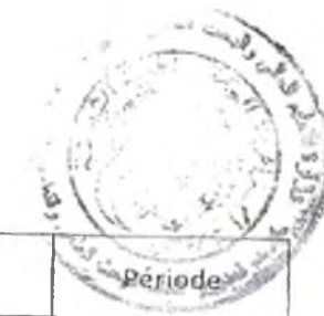
Tableau des établissements d'enseignement supérieur à couvrir par l'École Nationale Polytechnique -ENPC