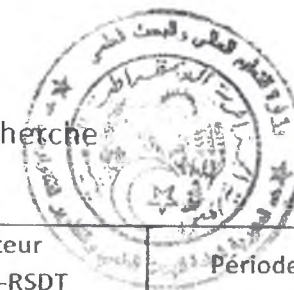
Tableau des établissements d'enseignement supérieur à couvrir par le Centre de Recherche Scientifique et Technique en Analyses Physico – Chimiques -CRAPC