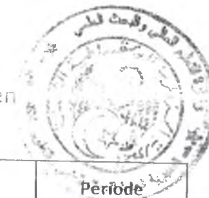
Tableau des établissements d'enseignement supérieur à couvrir par le Centre de Recherche en Biotechnologie -CRBT