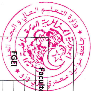
Tableau 1 : Synthèse sur l'introduction des listes de master 1