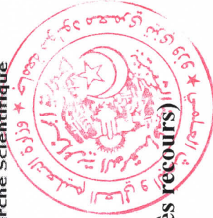
Tableau des critères de sélection Grade: " Ingénieur en Chef des Laboratoires Universitaires " (Après recours)

Circulaire N°7 du 28 avril 2011 relative aux critères de sélection aux concours sur titre pour le recrutement dans les grades de la fonction publique