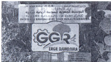
Entreprise Régional de Génie Rral Djurdjura

République Algérienne Démocratique et Populaire الجمهورية الجزائرية الديمقراطية الشعبية