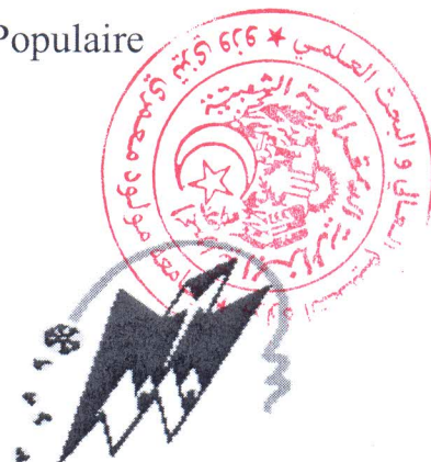
Université MOULOU Mamméri Tizi- Ouzou