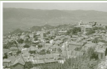
Paysage de la Kabylie

2.2. Le cadre législatif du Patrimoine Algérien et son impact sur la protection de l'architecture villageoise.